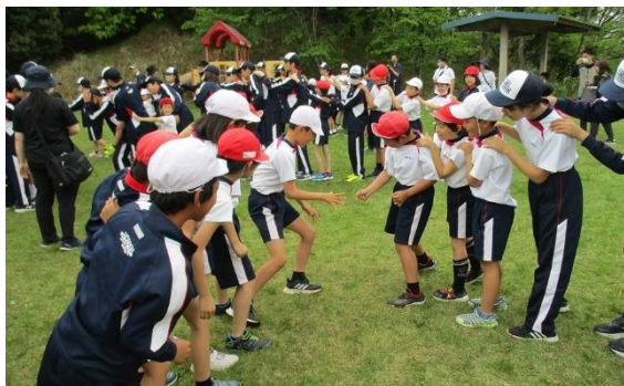
大いに盛り上がったじゃんけんゲームの様子