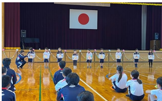
似顔絵を見せ自己紹介をする1年生の様子

その後は歓迎遠足を行いました。当日は心配された雨も降らず、みんなで春の山公園まで歩いていきました。春の山公園では生徒会役員のみなさんが企画したじゃんけんゲームや〇×クイズを全員で行いました。みんな楽しくゲームを行い、仲を深めることができました。