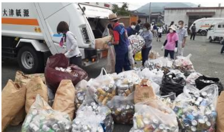
↑ PTA リサイクル活動の一場面(アルミ缶収集)

8月23日(日)に、PTA リサイクル活動が行われました。担当の委員の方々をはじめ、たくさんの方々に協力いただきありがとうございます。たくさんの方々の収益があると思いますので、子どもたちのために大切に使用させていただきます。