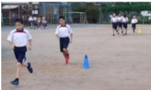
↑ 新人陸上大会に向けての朝練の一場面