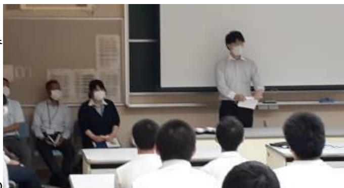
↑ 暴力団排除教室(8, 9年生)の授業風景

8月25日(火)に、高等科において、暴力団排除教室が実施されました。福岡県警から2名、八女警察署から3名の警察官の方々においでいただき、話を聞きました。暴力団のこわさや危険薬物との関係など、具体的な例を交えて話を聞き今後の生き方について考えを深めるための良い機会になりました。