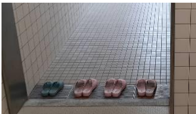
↑ 1年生、2年生のトイレのスリッパ

きれいに並んでいます 初等科(1~4年生)のくつばこやトイレの様子です。くつやスリッパが整然と並んでいます。スリッパ信号機は、青色です。とても気持ちがいいです。子どもたちが落ち着いて生活をしていることがわかり、うれしく思います。