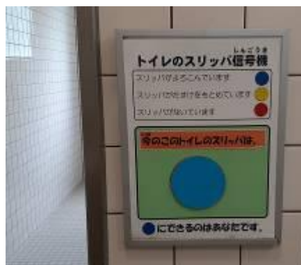
↑ トイレのスリッパ信号機